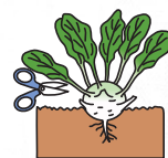
球の下部の葉は、葉柄を2~3cm残して切り取る

球の下部、根元付近は堅くて食べられないので、1~1.5cmは切り除いてください。収穫物は新聞紙に包んで冷暗所に置けば4~5日ぐらいは十分持ちます。