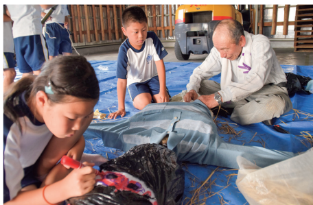
お米を守るこわいかかしを作る児童ら

12月上旬には、収穫祭を予定しており、各学年が育てた野菜を使った豚汁やおにぎりなどを作り、今年一年の収穫とお世話になった方々に感謝を伝えます。