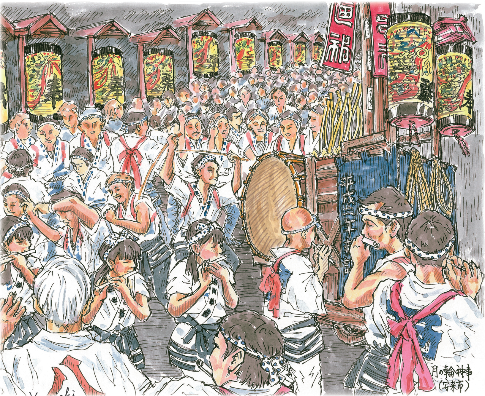
月の輪神事 (安南市)