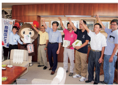
産地ビジョンのひとつ1億円産地達成に向け一致団結している様子

大田市ぶどう生産組合（9戸）は30～50代の若手生産者5人が中心となり、28年に策定した「産地ビジョン」を目標に活動しています。