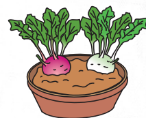
緑色と紅色の品種を対にして鉢植えで楽しむのも良い