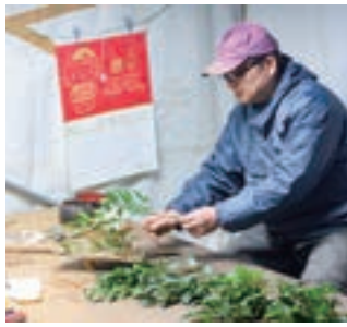
より良い商品にという想いが、市場に評価される高い品質を保つ秘訣につながっている。

前提で高さ30cm、底辺が25cmの2等辺三角形になるように数本を束ねた後、水揚げ・保水処理を行い出荷します。益田市と浜田市のほか、広島市の市場に出荷しています。