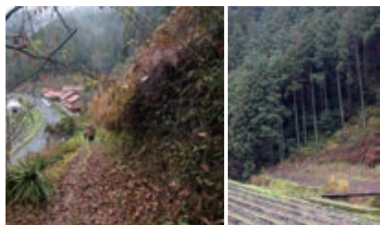
商人地区、急峻な中国山地の谷間に里山の暮らしを見せてくれます。

昭和48年、20歳の時、荒茶生産の専業農家として経営を引き継ぎました。旧日原町の商人(あきんど)集落は中国山地の山あいであり、ほとんどが森林で平坦な農用地は1パーセント未満と農業が不利な中山間地です。当時から高齢化が進み人口は減少、何とかしなければならぬと何度か集落で話し合いました。地区にたくさんあるものは、広大な里山と高齢者の労働力。掛け算の原理でこのたくさんあるもの同士を掛け合わせることであればより大きいもの、すなわち新たな核となる特産品を創り出すことができます。里山を活用できるものには何が