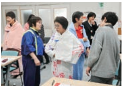
タオルケットを利用して作った「ガウン」