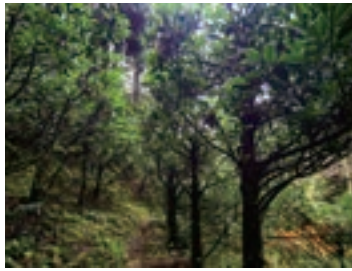
作業しやすいよう整備された里山に榊が立ち並ぶ。近いからこそ手入れが行き届き、その努力と時間が立派な畑に。

ど持って苗を探して山奥まで取りに行っていました。先端の細かい毛細根まできちんと取らなければならず、重労働かつ効率が悪く「これじゃだめだ」と痛感しました。そこで種苗会社4、5社から数種の苗木を取り寄せ、それぞれの世帯で東西南北や日照時間の違う条件で榊を植えて品種を比較、集落に合った榊を選び植栽をはじめました。先進地で勉強する機会がもてないため、栽培方法から病気や害虫の種類や対策まで試行錯誤を繰り返しながらこれまで行ってきました。幸い、榊はお茶と同じツバキ科の植物だったので親しみが有り、これまでの経験が生かせる時がありました。榊の生産は今年で30年目になりますが、生産者全員の頭の中にあつた知識を体系化した栽培マニュアルは、近年になってようやく新規生産者に渡せるようになりました。大変な作業の1つには、点在する榊の場所まで肥料を持って行き散布するのが労力を要します。