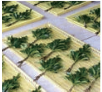
「凜とした」という表現が正しいかどうかは別として、こんな綺麗で立派な榊を見るのは正直初めてでした。「本物」という言葉がふさわしい。