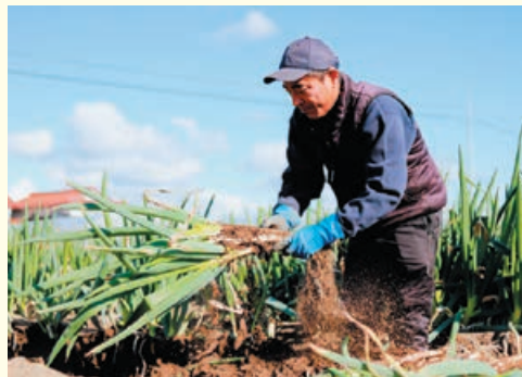
雨が降ると作業工程が増えるため、晴れの日に多めに収穫するなど事前に調整しながら収穫を進めます