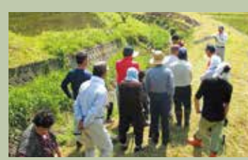
設置講習会の様子

長谷地区は平成27年度にイノシシによる甚大な被害を受けたことから、その年に研修会を開き、集落をあげた対策に乗り出しました。研修会では、被害状況を確認し、イノシシの習性などを学び、5月には電気柵の設置講習会を開催。獣害対策への正しい知識が広まり、昨年