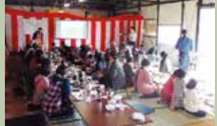
収穫祭で研修を行いました

はついに被害ゼロを達成しました。また、隣の寺沢地区では地区全体を囲むように約4キロにもおよぶ防護柵を設置しています。様々な集まりで情報共有を行うことで協力体制が構築され、設置の際は延べ200人が集まりました。維持管理体制も整っており、昨年の水稲被害はゼロとなりました。