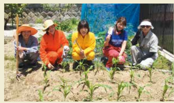
▲大きく育ちますように

参加した部員は「植えた苗の成長や、着果するか心配だが収穫がとても楽しみ。できた野菜で料理教室をしたい」と汗をぬぐいながら笑顔で話しました。