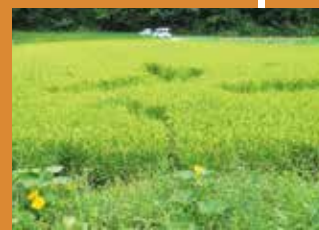
イノシシによる踏み倒しの被害

被害が発生した場合はまず、個人で被害状況を把握します。見回りの際に気を付けることで些細なことにも気づけるかもしれません。