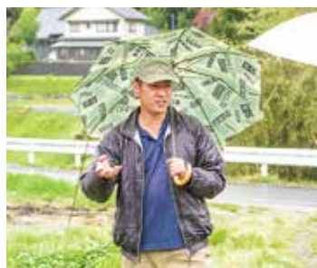
お菓子×農業（農作物）というビジョンを優しい眼差しで、まっすぐに語っていただきました。

作っていきたくて考えています。地域性かどうかはわかりませんが、自治会が農作物の加工場を作るなど、邑南町は新しいことへ挑戦することに積極的だと感じています。もともと作ることが好きでパティシエになりましたが、今は農業で安定した経営基盤を作り、地域の加工場も活用しながら、私も新しい夢に向かって進んでいきたいです。