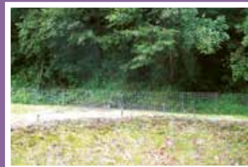
草を刈って見通しを良くする

近年、中山間地域を中心に鳥獣被害が深刻な状況となっています。エサ場や隠れ場所となる耕作放棄地が増加し、集落に入ってくる獣が増えています。そのため個人での対策だけでは追いつかなくなっています。