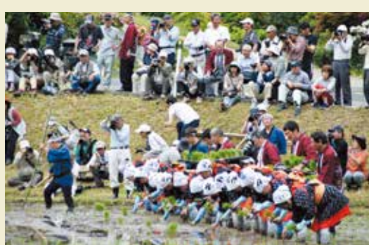
▲参加者は初夏の風物詩を楽しみました