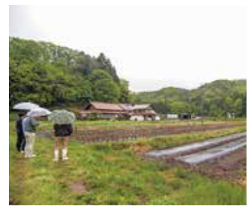
地域や我々JAとの関わりが、継続の力になっているとお話をいただきました。

はじめから邑南町に住みたかったというわけではなく、研修制度が充実していたという理由で邑南町を選びました。現在は畑に歩いていける距離の一軒家に住んでいます。住んでみると、地域の人がとても優しく迎え入れてくださり、気軽に色々な話や相談ができるので、ここを選んで良かったと思っています。独立して2年目になりますが、す