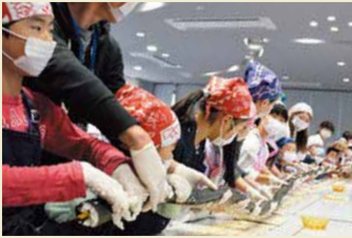
▲真剣な表情で長巻寿司を作るキッズ生

5月19日には、入校式と併せてサツマイモに関する講義やJAしまね雲南女性部の協力のもと、長さ9メートルにも及ぶ長巻寿司作りにも挑戦。キッズ生は手助け役の大人と一緒に作業を進め、タイミングを合わせながら巻き簾 すずり を使って仕上げると「できた」「やった」と歓声