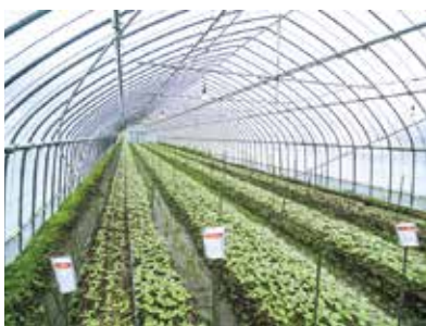
就農直後から取り組む花の栽培。ヒマワリが定植されていますが、一年を通したサイクルで品種が練られています。

私は広島市の出身で、市内の洋菓子店でパティシエとして働いていました。広島には洋菓子店はたくさんあり、競争が激しく、将来独立することを考えた場合に何か特徴のあるケーキ屋を開きたいと考えていました。そこで野菜を使ったお菓子作りをしたいと思います、30才の時に研修先を探していたところ「おーなんアグサポ隊」という制度を知り、邑南町へ1ターンしました。この制度を活用し、地域おこし協力隊として3年間、町の専用農場や周辺の農家、営農組織に出向き、定植や収穫、出荷作業を手伝いながら、農作業に必要な経験を積みまし