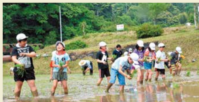
▲もち米の苗を手植える三刀屋小の児童