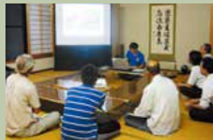
検討会を開き来年度の対策を協議

金成下地区は5年前からイノシシ被害の対策を進めています。当初は被害が出ている人とそうでない人との「対策意識の差」がありました。研修会や検討会を通じて、被害状況などの情報を広報誌