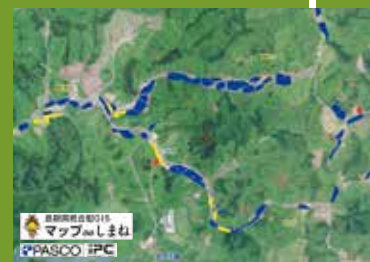
被害状況マップの作成

また、対策方針や対策に取り組む体制づくりについてみんなで話し合うことで、獣害対策への基盤ができます。