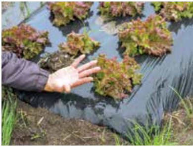
分からないことだらけ、という中で、見聞きしながら最良を見つけ出すというのが西森スタイル。

策をするのを目の当たりにし、農家が見えないところで品質向上のために大変な努力をしているのを知りました。サニーレタスは栽培するのは簡単な方だと思っていました。実際に自分で作ってみると、天気に左右され生育スピードが計画通りにいかない、大きさが揃わないなど、農家の大変さを痛感しました。近所にサニーレタスを栽培している方がいるので、アドバイスをいただきながら、畑を見比べ、試行錯誤を繰り返しています。また就農時には、ハウスや機械などの設備投資の資金や運転資金なども課題でしたが、県や町、JAしまねの支援を受けることで就農することができました。私は小売業で働いていたので