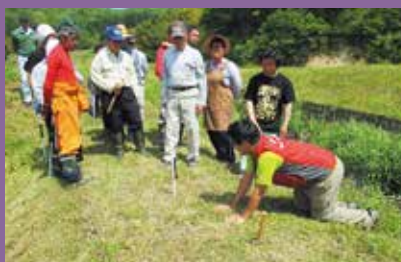
獣の気持ちになった対策を実施

集落の状況に合わせて、捕獲・防除・環境整備など取り組みやすい対策から始めましょう。