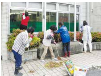
見違えるほど綺麗になりました

雲南女性部は今年度から「私たちにできるJA自己改革」として支店の美化活動に取り組みます。日頃お世話になっている支店への恩返しとし