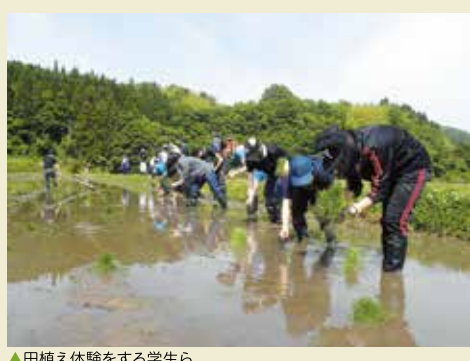
▲田植え体験をする学生ら

松江市の島根大学の学生グループは、不規則になりがちな学生の食生活を正そうと農業体験などの企画を通じて、食生活の改善を呼びかけています。