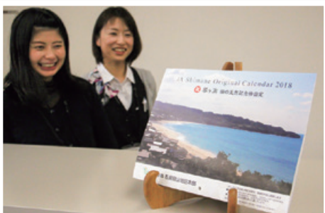
琴ヶ浜が表紙を飾るJAオリジナルカレンダー