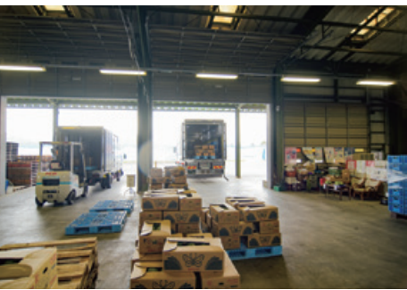
中海干拓事業所にある集荷場から市場へ