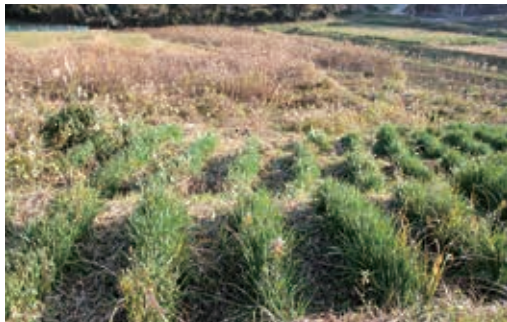
整列して植えられたスイセン畑。

した。また、畑では葉タバコを作る農家もありましたがそれも減少していき、皆が試行錯誤しながら生活する時代を送っていました。そんな時、隣の三隅町（現・浜田市）に火力発電所が建設されることになり、その予定地の用地買収が始まる前にお願いで、自生していたたくさんのスイセンの球根を掘らせてもらいました。1983年頃からそれらを休耕田に植え、商品用のスイセン栽培を本格的にスタートさせました。