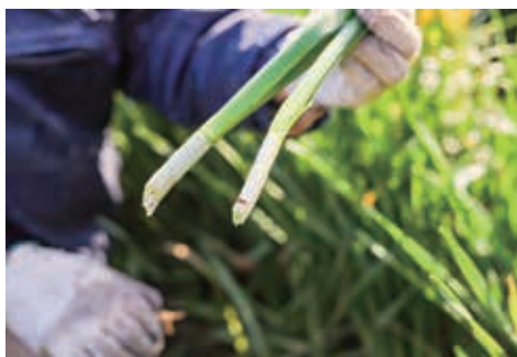
根元近くの「はかま」と呼ばれる部分。

件の良い状態は、「葉っぱが4枚、花が4つ」ついでいて、さらに「はかま」と呼ばれる球根の上にある白い筒状の部分の長さで優劣が決まるため、これを一本ずつ丁寧に分けていくのにとっても労力がかかります。また、スイセンの出荷ピークは一年で最も寒い時期。基本的に露地栽培なので、天気が悪い日の切り取り作業は非常に大変です。それでも出荷日は決まっているので、雨や雪が降ったり冷たい風が吹く中でも作業を行わなければなりません。