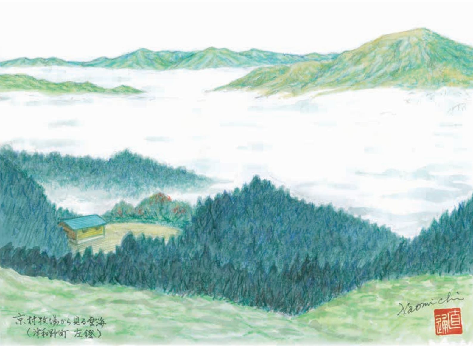
京村牧場から見る雲海 (津和野町 左鏝)

◀ 今月の特集 ▶ 島根のいいもの再発見!! 「益田市 スイセン」 西いわみ地区本部