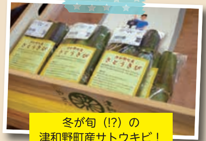
冬が旬(!?)の津和野町産サトウキビ!

も、研修を終えた新規就農者が同産直へ出荷し、産直が賑わうことを心待ちにしている。1月にはイチゴや葉ワサビといった冬の農産物が並ぶ。また、農産物が少なくなる冬の時期でも、道の駅近くの加工所を活用して加工品を充実させるなど、1年を通して訪れる人々にとって魅力的な産直となるよう創意工夫を凝らす。