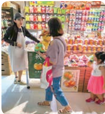
島根産西条柿のおいしさをPRした （写真はシンガポールの店舗）

販売したのはシンガポールの5店舗と今年新たに開店した香港の店舗。11月にはJA職員らが現地です「西条柿」「島根あんぽ」「干し柿」を販売PR。現地の人は「西条」の形と黄色の色味が珍しい様子でしたが、試食すると「甘くておいしい」と好評でした。現地のバイヤーからは「生果を来年は倍ぐらい取り扱いたい」と要望があり、対応した職員も「実際に販促して売れ行きや現地の人々の反応もよかった」と手ごたえを得ました。今後は6月のデラウェアやシャインマスカットから西条柿の取扱いへとつながるよう交渉を進めていきます。