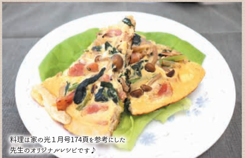
料理は家の光1月号174頁を参考にした先生のオリジナルレシピです♪