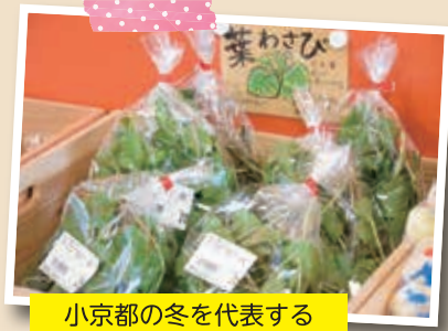
小京都の冬を代表する味覚のひとつ 葉ワサビ

道の駅津和野温泉なごみの里には、同産直のほか、日帰り温泉やレストランが併設されており、津和野の新たな魅力を発見できる。津和野を訪れた際にはぜひ立ち寄りたい。