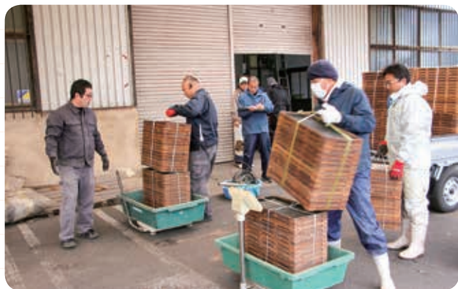
持ち込まれた廃プラスチックの計量を行う職員

今後もJA石見銀山地区本部では、関係機関と連携し、廃プラスチックの回収を通して、環境に配慮した農業の推進に取り組みます。