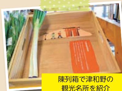
陳列箱で津和野の観光名所を紹介 さすが観光地の産直です