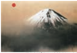
横山大観「神国日本」(昭和17年)

高校生 / 通常 1,000円 → 700円 小中学生 / 通常 500円 → 300円